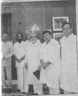
দলের নেতারা। বৃহস্পতিবার।

জন প্রকাশিত হয়েছে ৩০ জুলাই। এতে স্বাক্ষরিত হওয়ার পর সবার আগে র অভিযোগ তুলে সর্বব্যাংলার মুখ্যমন্ত্রী নাগরিকদের পাশে থাকার বাতী দিয়ে করেছিলেন স্বরাষ্ট্রমন্ত্রী রাজনাথ সিংয়ের ৮ জনের এক প্রতিনিধিদলকে অসমে য়ে ফেরত পাঠিয়েছে অসম সরকার। এর লীন এবং রাজ্যসভায় ডেপুটি চেয়ারম্যান র প্রতিনিধিরা রাষ্ট্রপতির সঙ্গে দেখা করে রিত অভিযোগ জানান। একে বিরোধী মনে করছে রাজনৈতিক মহলের একাংশ। নাগরিকপঞ্জিকে সম্পূর্ণ রাজনৈতিক স্বার্থে ও কেন্দ্রীয় সরকার।